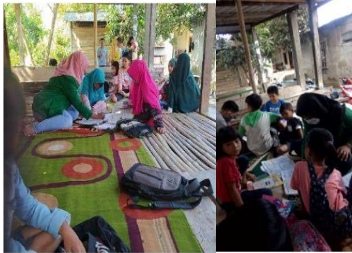
Gambar 2 Pendampingan Pengajaran Kepada Siswa SD