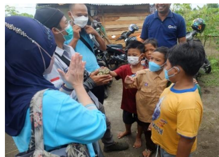
Gambar 1. Kegiatan penyuluhan kepada masyarakat target