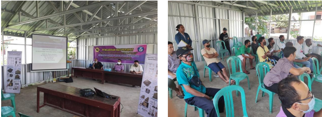
Gambar 3 Pembukaan dan Peserta Kegiatan

Dilanjutkan dengan pelatihan atau praktek pembuatan tulangan balok atau kolom dipandu oleh Tim Pelaksana dari Magister Teknik Sipil Unram.