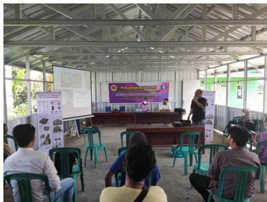
Gambar 4 Materi dan Kegiatan Ceramah