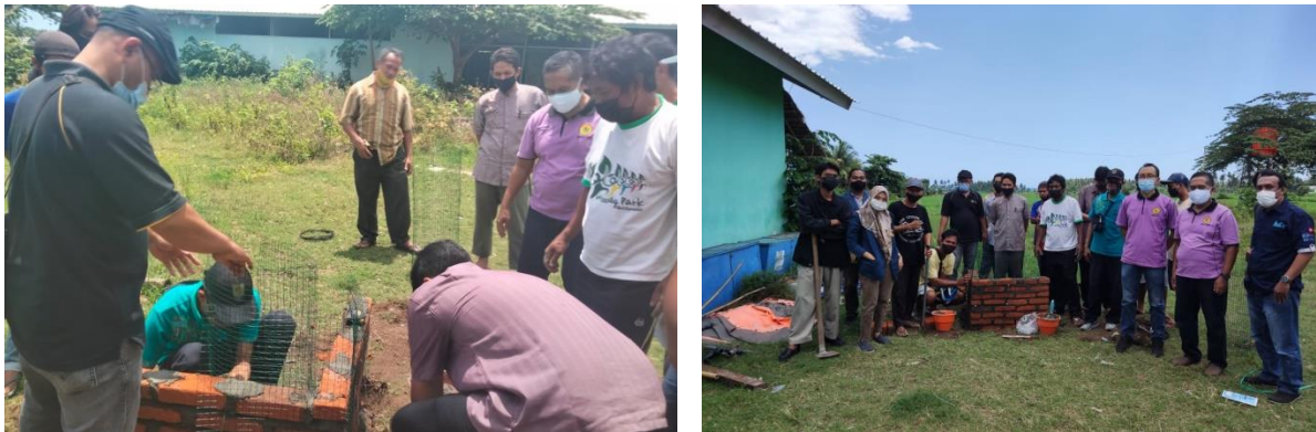
Gambar 5 Kegiatan Praktek Lapangan

Kegiatan praktek ini langsung dilakukan oleh masyarakat sendiri dengan dipandu oleh Tim Pelaksana dari Magister Teknik Sipil Unram. Gambar 5 menunjukkan kegiatan praktek lapangan.