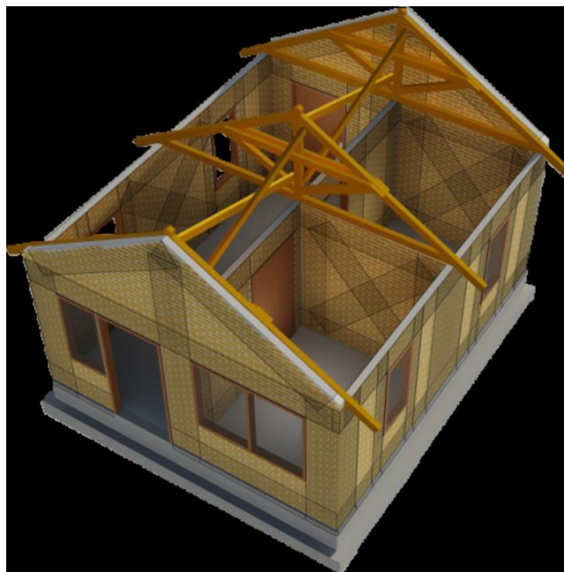
Gambar 2 Typical rumah tembokan dengan balutan ferosemen (Boen, 2009)

Metode kegiatan dilakukan dengan metode ceramah tentang penyebab terjadinya gempa yang dilanjutkan dengan tanya jawab dengan tim pengabdian. Setelah metode ceramah dan diskusi dilanjutkan dengan praktek merangkai besi beton untuk pembuatan balok maupun kolom beserta tulangan gesernya. Kegiatan dilanjutkan pembuatan tembokan dengan batu bata dengan kolom beton yang aman terhadap bahaya gempa. Typical Rumah Tembokan dengan balutan Ferosemen dapat dilihat pada Gambar 2.