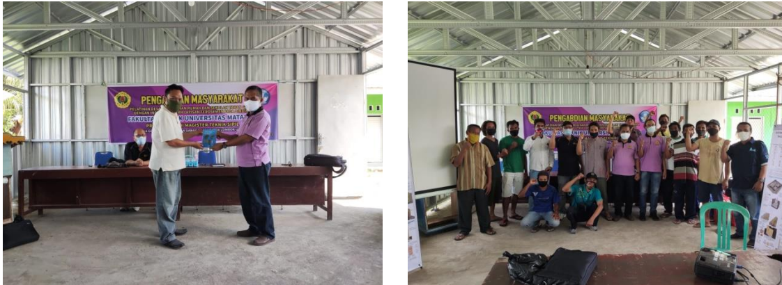
Gambar 6 Kegiatan Penutup