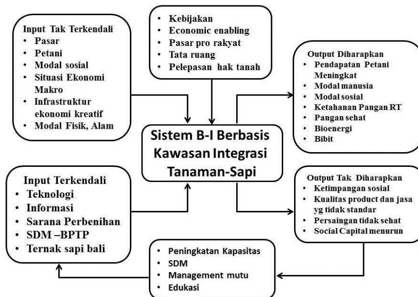
Gambar 2. Diagram Input-Output Sistem Bioindustri (B-I) Berbasis Kawasan Integrasi Tanaman-Sapi

Input merupakan faktor yang mempengaruhi kinerja sistem yang dapat digolongkan ke dalam input langsung dan tidak langsung. Input langsung adalah faktor-faktor yang mempengaruhi kinerja sistem secara langsung, yang terdiri atas input terkendali dan tidak terkendali. Input terkendali ( controled input ) adalah input yang secara langsung mempengaruhi kinerja sistem dan bersifat dapat dikendalikan. Input tak terkendali ( uncontroled input ) merupakan input yang diperlukan agar sistem dapat berfungsi dengan baik namun tidak dapat dikendalikan atau berada di luar kendali kerja sistem. Input lingkungan ( environment input ) merupakan elemen-elemen yang mempengaruhi sistem secara tidak langsung dalam mencapai tujuan. Input ini biasanya berada di luar batasan sistem, sehingga sering disebut sebagai input tidak langsung. Output merupakan tujuan kajian sistem, yang dapat dikategorikan sebagai output yang diinginkan ( desired output ) dan yang tidak diinginkan ( undesired output ). Output yang diharapkan dari model yang dibangun misalnya adalah diperolehnya produksi padi atau beras untuk mencukupi kebutuhan pangan secara berkelanjutan. Output yang tidak diinginkan merupakan hal yang tidak dapat dihindari dan kadang-kadang diidentifikasi sebagai pengaruh negatif bagi kinerja sistem.