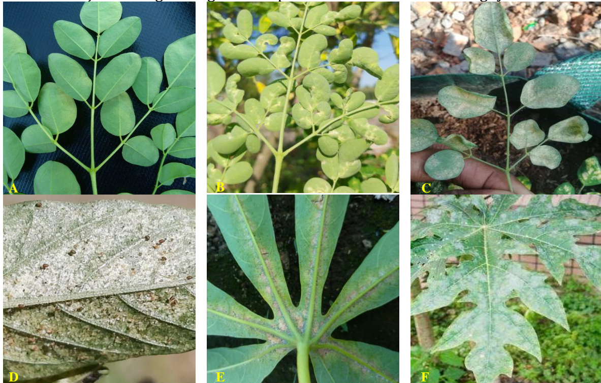
Gambar 1. Gejala serangan tungau hama pada tanaman kelor dan inangnya

Keterangan : (A) Daun kelor sehat. (B) Gejala serangan sedang. (C) Gejala serangan tinggi. (D) Gejala serangan pada bayam. (E) Gejala serangan pada ubi kayu. (F) Gejala serangan pada pepaya